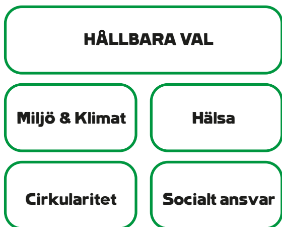
Figur 3. De fem prioriterade hållbarhetsområdena som är grunden för hållbarhetsstrategin 2033

Hållbarhetsstrategin 2033 utgår från vårt medlemslöfte, Tillsammans ger vi varje medlem mer och beskriver hur vi ska arbeta med helheten inom hållbar utveckling dvs alla tio parametrar inom hållbarhetsdeklarationen. Socialt ansvar har särskilt lyfts ut som ett viktigt område. Även Hälsa och Cirkularitet. Se figur 3 nedan som visar de fem prioriterade hållbarhetsområdena.